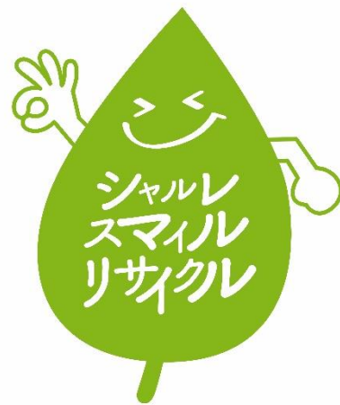
「シャルレ スマイルリサイクル」ロゴ